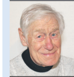
Von Paul Göttin

Wer heute etwas auf sich hält, ist diskriminiert, denn Diskriminierte können stets auf das Mitgefühl der Mitmenschen zählen. Das betrifft nicht nur Frauen, die es noch nicht zu Direktorinnen geschafft haben, sondern auch alle anderen Zeitgenossen, wie zum Beispiel Langschläfer, die dem lieben Gott die Zeit stehlen, oder Kaffeetrinker, die die Fronarbeit der Kaffeepflücker in exotischen Ländern unterstützen.